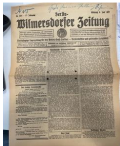
Wilmersdorf, auch 1917