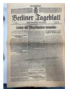
... aus dem Jahre 1917

Angesichts einer Kellerbegehung (Brandbegehung ...) im Elektroraum hinter einer alten Stellwand aufgewunden: Ein blauer Blechschrank mit der Aufschrift 1919-1929. Verschlöschen. Flugs einen zeitgenössischen Schlüssel besorgt und aufgeschlösschen: Darinnen ein großer Koffer, mehrere Aktenordner und eine alte Aktentasche. Randvoll mit Fotoalben der Schule, Zeitungen aus dem ersten Weltkrieg, Gefallenenanzeigen von Schülern und Lehrern der Schule, Tagebüchern, Satzungsberichten und Schülerzeitungen bis 1968. Das war auch das Jahr, in welchem der Schrank wohl verschlösschen und seitdem nicht mehr geöffnert wurde. Ein Schatz, der gesichtet,