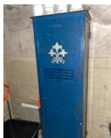
Der Blaue Schrank